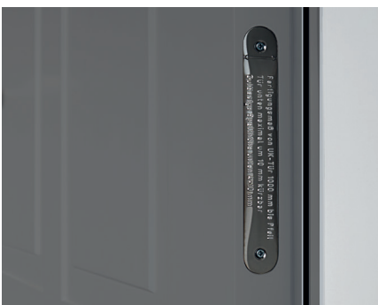
GEPRÜFTE QUALITÄT KENNZEICHNUNG DURCH PRÜFPLAKETTEN