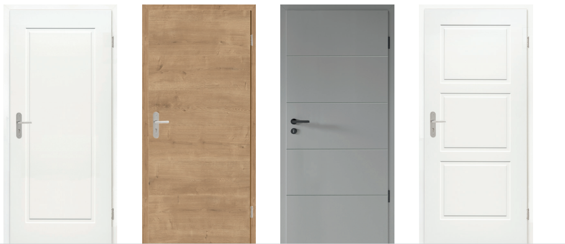
01 METRO 1 WEISSLACK

Produktbeispiele für verschiedene Garagenverbindungstüren: