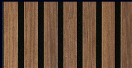
Nussbaum 07034 / Holznachbildung