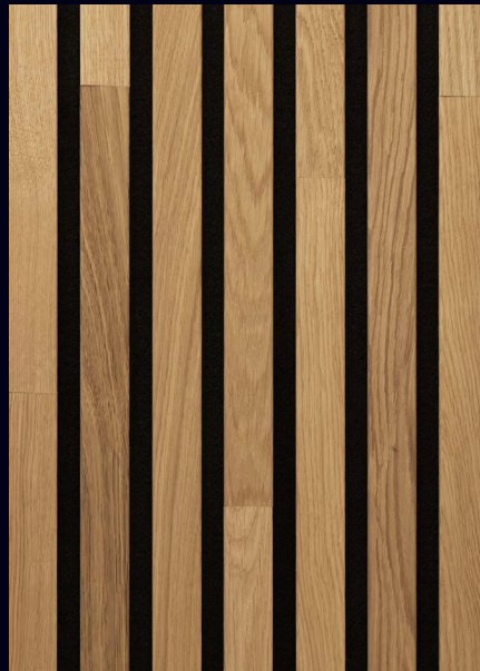
Eiche natur 04310 / gebürstet / mattlackiert