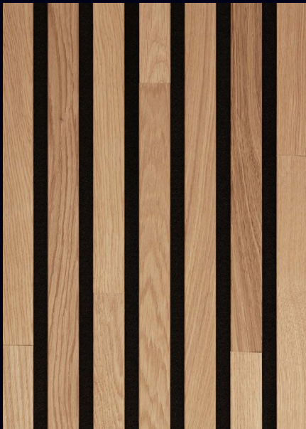
Eiche pure 04311 / gebürstet / mattlackiert