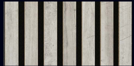
Gravel Stone 07035 / Dekor