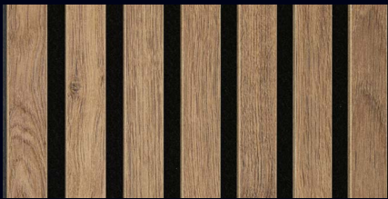
Eiche terrabraun 07031 / Holznachbildung