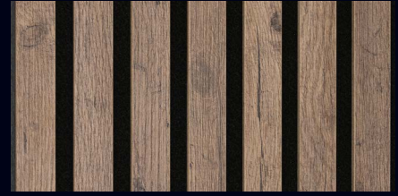
Altholzleiche 07032 / Holznachbildung