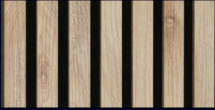
Eiche hell 07030 / Holznachbildung