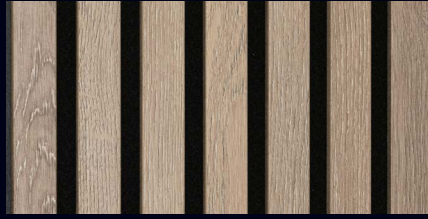
Eiche multicolor 07033 / Holznachbildung